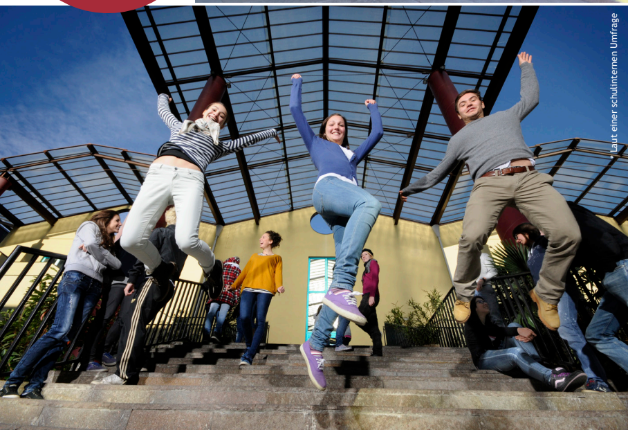
Laut einer schulinternen Umfrage